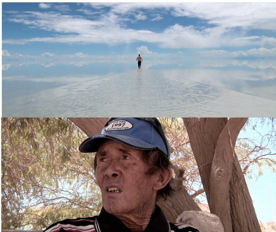
Imagen 2: Fotogramas de las localizaciones definitivas de Radio Atacama: Salar de Uyuni (Bolivia) y Pedro de Valdivia (Chile).